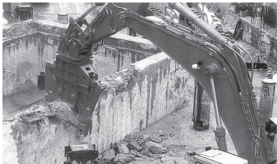
コンクリート壁解体に 活躍する圧砕機

さまざまな解体現場の、主に鉄筋コンクリート構造物を大割解体するのに用いられます。